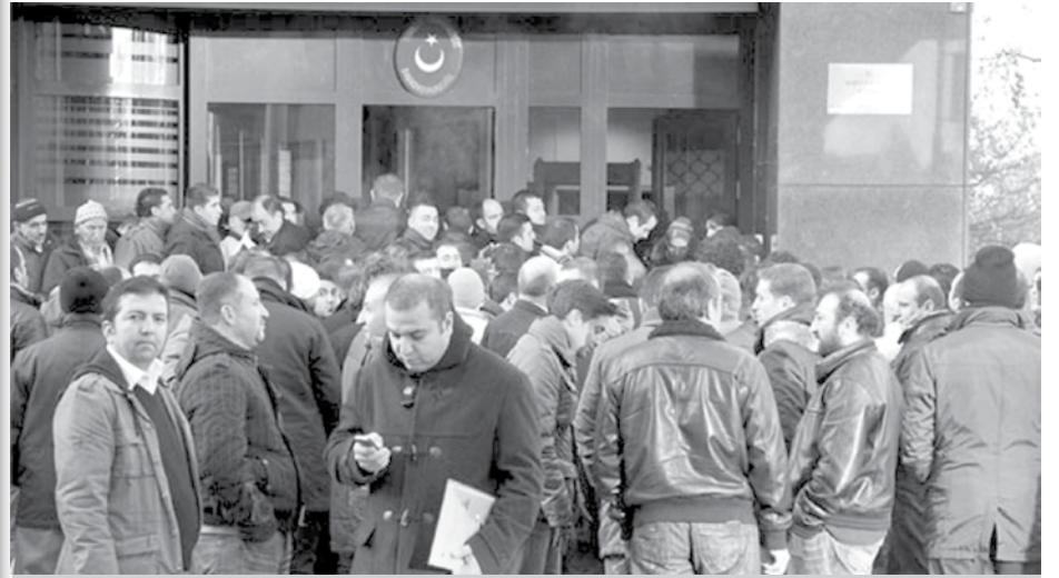
Bedelli askerlik için geceden kuyruğa giriyorlar

Yeni düzenlemeye göre ise, işçi, işveren sıfatıyla veya bir meslek ve sanat sahibi olarak yurtdışında oturma ve çalışma iznine sahip olan göçmenler, en az 3 yıl süre ile fiilen yabancı ülkelerde çalışmış olmaları şartıyla, 10 bin € ödeyerek, 21 gün süreli temel askerlik eğitimine tabi tutulmadan "vatan borcunu" yerine getirmiş sayılacaklar. Bu düzenlemeyle, AKP hükümeti yaşadığı ekonomik krizi ve oluşturacağı savaş ordusunu finans kaynağını "döviz yumurtlayan"