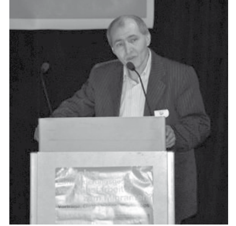
şam felsefesinin bu sözle net ifade edildiğini belirtti.

mücadele deneyimlerine sahip bir kurum olarak, Türkiyeli göçmenlerin hakiki sesi olduğumuzu seslendirmek zorundayız. Bu konferans bir ilk deneyim olarak başarılı geçmiştir. Eksiklerimizi giderek bu tartışmalarda ısrarcı olacağız ve başaracağımıza olan inancım tamdır' sölerine yer verdi.