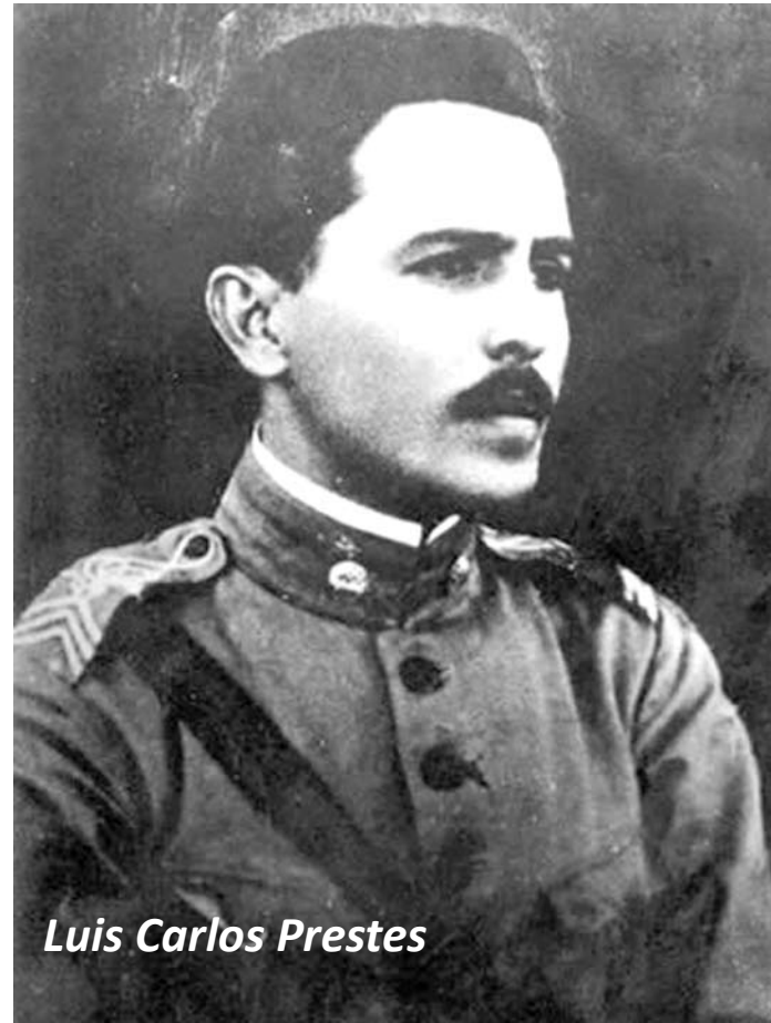
Luis Carlos Prestes

Gerçek halk hareketlerinin gelişmesiyle ve özellikle de bağımsızlık ve anti-emperyalist karakter taşıyan ve silahlı mücadeleyi önemseyen hareketlerin gündeme gelmesiyle birlikte, devletin saldırıları daha da artıyor. Bu durum sadece Brezilya için geçerli değildi. Örneğin Uruguay'da bağımsızlık hareketleri ve halk hareketleri hızla gelişmeye başlamıştı.